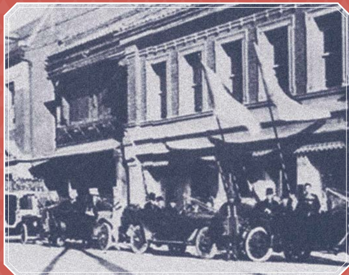
明治24年、横浜の中心街・本町1丁目13番地に新築された明治屋の社屋。

明治時代に船舶への食料品を納入する業務から創業した明治屋の歴史にちなみ、会場は横浜、神戸、北九州の門司などの港町を中心に選定。会場ごとにお招きする落語家の方々による落語をたっぷり満喫していただけるほか、「缶詰博士」として著名な黒川勇人氏による缶詰トークもお楽しみいただけます。