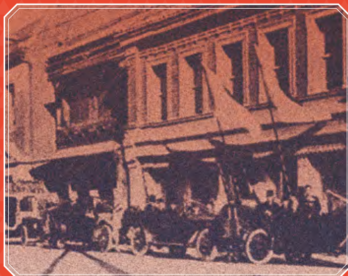
明治24年、横浜のメインストリート、本町1丁目13番地に新築された社屋。

明治時代に船舶への食料品を納入する業務から創業した明治屋の歴史にちなみ、会場は横浜、神戸、北九州の門司などの港町を中心に選定。会場ごとにお招きする落語家の方々による落語をたっぷりと満喫していただけるほか、「缶詰博士」として著名な黒川勇人氏による缶詰トークもお楽しみいただけます。