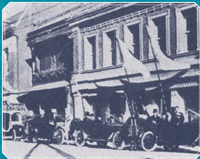
明治24年、横浜の中心街・本町1丁目13番地に新築された明治屋の社屋。

明治時代に船舶への食料品を納入する業務から創業した明治屋の歴史にちなみ、会場は横浜、神戸、北九州の門司などの港町を中心に選定。会場ごとにお招きする落語家の方々による落語をたっぷり満喫していただけるほか、「缶詰博士」として著名な黒川勇人氏による缶詰トークもお楽しみいただけます。